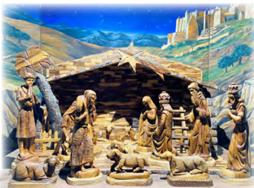
Betlém z Betléma v blanenském dřevěném kostele