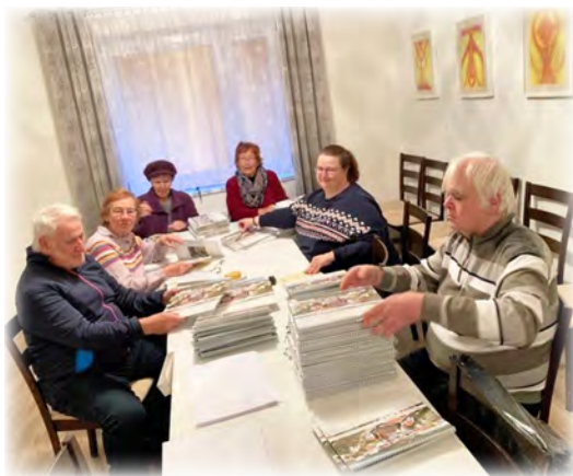
Jedna z etap skládání do obálek