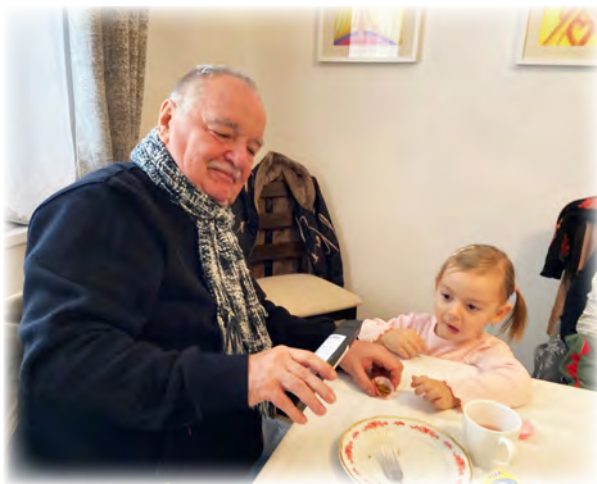
Klaudince moc chutnalo, co papal Jan Křtitelem

Večer se konal poslední nedělní adventní koncert, u nás velmi oblíbené cimbálové muziky Majerán. Lidová hudba se i u nás těší oblíbě. Přišlo více než sto třicet spokojených posluchačů, přičemž si mnozí rádi s muzikanty zazpívali.