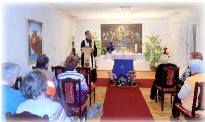
Vánoce v Račicích