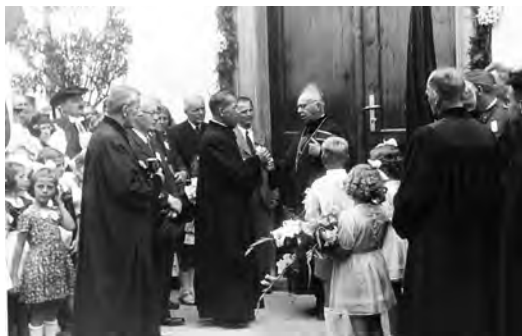
Posvěcení Sboru Cyrila a Metoděje v r. 1949

Za jeho působení bylo na Vyškovsku v náboženství průměrně vyučováno 170 dětí na 10 školách, na bohoslužby chodilo v šesti obcích (Vyškov, Rousínov, Račice, Ježkovice, Ruprechtov a Olšany) 480 věřících, křtů bývalo průměrně 30 ročně, oddavek 20 a pohřbů 25.