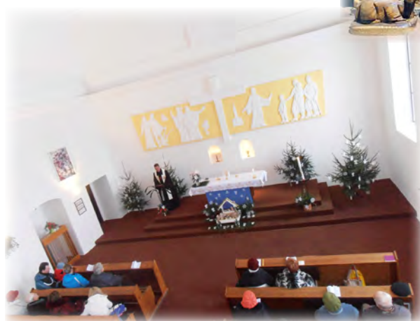
Vánoce v Rousínově, pohled z kůru

S Boží pomocí se nám podařilo všechno v týdnu před Vánocemi připravit pro příjemné slavení bohoslužeb na Blanensku i Vyškovsku.