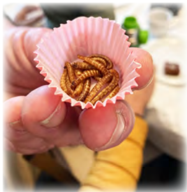
Potrava Jana Křtitele pro odvážné

V posledním týdnu adventu před vánočními svátky jsme se setkávali k ranním bohoslužbám každý den v 6:30 hodin.