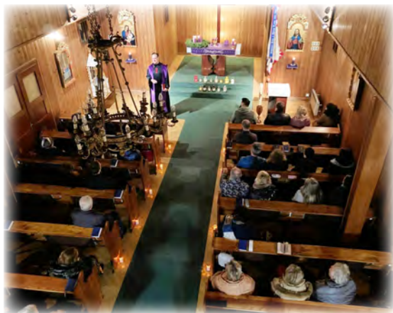
Pohled z kůru při rorátech v sobotu 10. 12. 2022