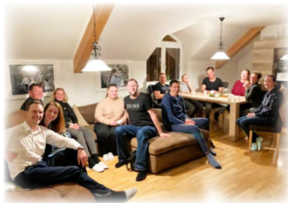
Setkání přípravek na křest a obnovu křestních slibů