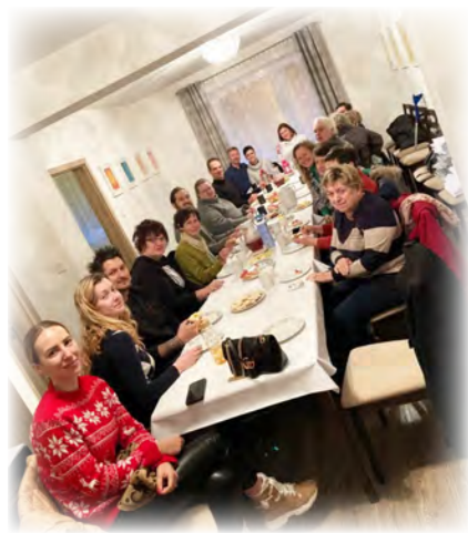
Účastníci rorátní snídaň