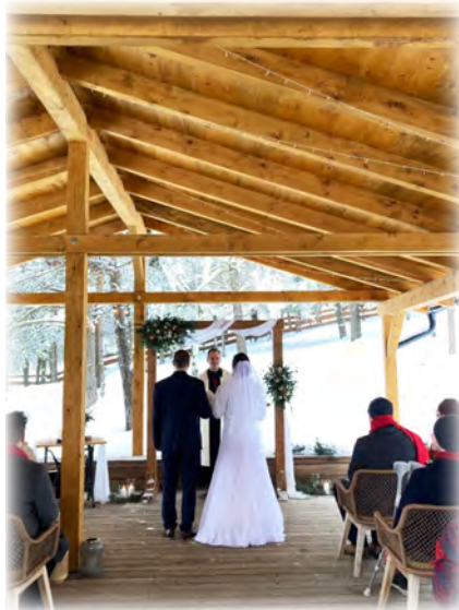
Svatba v bílém 17.12. 2022