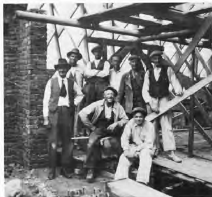
Rekonstrukce Sboru v Rousínově v r. 1948

Velkým počinem byla adaptace 400 let staré židovské synagogy v Rousínově na sbor Cyrila a Metoděje. To se podařilo L. P. 1949.