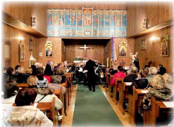
Vzpomínka na jeden z koncertů – v neděli 11. prosince 2022 účinkoval Komorní orchestr města Blanska