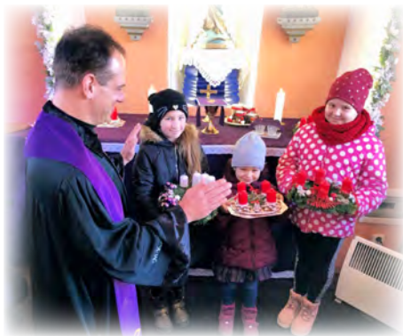
Požehnání adventních věnečků na Brťově