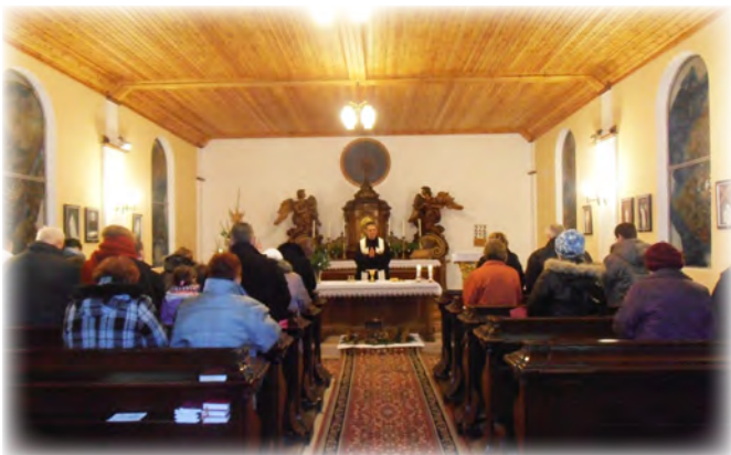
Narození Páně v Ježkovicích