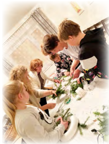
Společné pletení adventních věnců

Poslední bohoslužbu uplynulého církevního roku jsme slavili v pátek 25. 11. 2022 v 17:30 hodin s přáním všem Kateřinám. To se již definitivně uzavřel li-