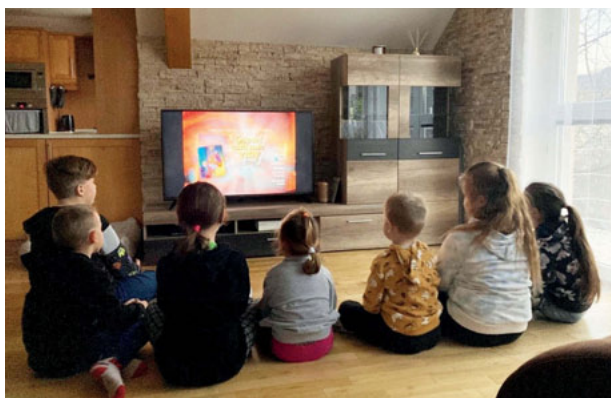
Děti sledují biblický příběh/

Každý správný rodič jistě vnitřně cítí, že je dobré dát dětem dobré základy do života, a to i ve zkušenosti víry, duchovního života a vnitřní kultury lidského života.