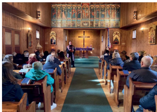
Úvodní bohoslužby v neděli 12. března L. P. 2023/

Rád bych vás seznámil s tím, jak jsme prožili rok L. P. 2022.