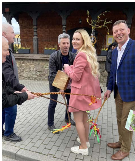
Ženy byly pohlazeny mladým vrbovým proutím ještě před pondělní bohoslužbou