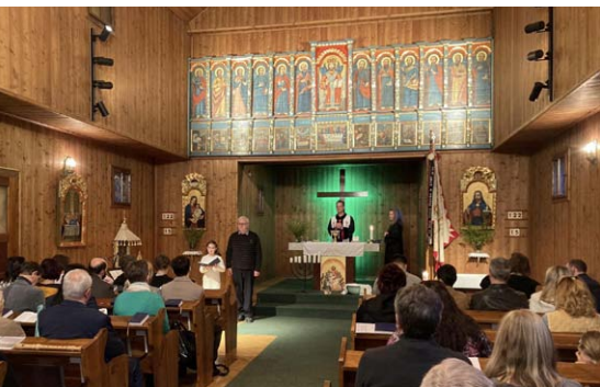
Bohoslužba na Zelený čtvrtek se zeleně nasvíceným křížem

„Dokonáno jest,“ zaznělo k nám na Velký pátek z Janových pašijí z Ježíšových úst, za naše viny a hříchy. Mohli jsme plně prožít v našem společenství, co pro nás znamená: „Neboť Bůh tak miluje svět, že dává svého jediného Syna, aby žádný, kdo v něho věří, nezahynul, ale měl život věčný.“ Na Velký pátek nezvoní zvony, ty nahrazují naši tzv. „hrkači“, na památku utrpení nehrají varhany, ale náš sbor a my všichni sestry a bratři jsme zpívali písně o smyslu Ježíšovy oběti za nás. Uvědomovali jsme si, co pro nás osobně znamená tento den dnes v L. P. 2024. Děkujeme za přípravu a scénické čtení pašijí podle Janova evangelia, přímlybné modlitby, Žaloby Páně a bdění u Ježíšova kříže. Po bohoslužbách v Blansku jsme šli každoroční venkovní velkopáteční křížovou cestu do Černé Hory. Už za tmy. Vždyť začátek