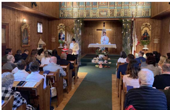
Na Boží hod velikonoční vynikla tentokrát na světle nádherná výzdoba kostela