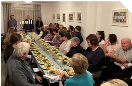
Sederová večeře L. P. 2024