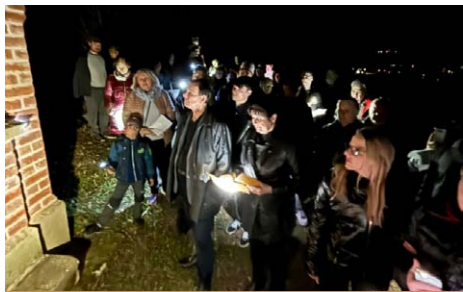
Křížová cesta v Černé hoře