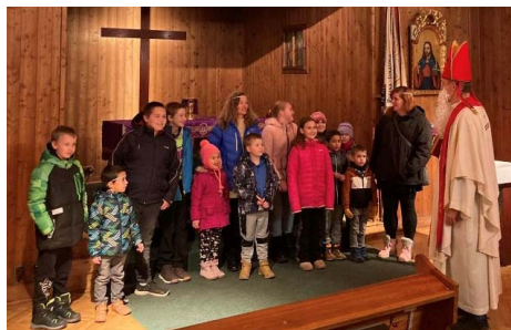
Děti vítají sv. Mikuláše v našem Dřevěném kostele

návštěvníky v kostele. Malý pozdrav z Rousínova, adventní bohoslužby a srdečné pozvání pod střechu kostela, který byl původně židovskou synagogou. Budova stará pět století žije. Bohu díky. Přijďte se k nám podívat. Bohoslužby jsou každou adventní neděli v 17:00 hodin a k tomu různé koncerty a výstavy.