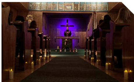
Sobotní ráno při rorátech v Blansku

Jak jsme prožili advent ve Vyškově? Myslím, že docela intenzivně. Kromě pravidelných nedělních bohoslužeb jsme v sobotních ránech měli roráty, po kterých vždy následovala společná snídane v sakristii. Při nich jsme si popovídali o všem možném, rozebrali jsme právě vyslechnutá