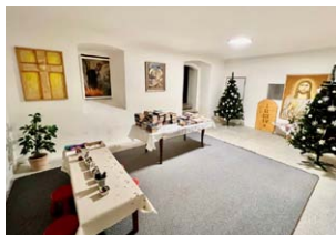
...a krásně adventně vyzdobená rousínovská farnost.