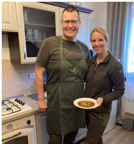
...a uvarili nám i vynikající zvěřinový guláš.

Je dlouholetým zvykem v našich farnostech Vyškov a Blansko se společně vidat při různých příležitostech. Věřící na Blansku a Vyškovsku se setkávají k bohoslužbám na 12 místech, ale faráře máme jednoho. Protože je neděle Ježíše Krista Krále na konci liturgického roku, míváme tradičně farní den jako tzv. SILVESTR a již po několik roků nás hostí ježkovští farníci. Nejdříve jsme v neděli 24. listopadu 2024