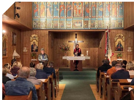
Robí nám čel z Starého zákona

V sobotu 2. 11. 2024 jsme se po západu slunce společně setkali na bohoslužbách v Blansku se vzpomínkami na naše blízké. Při zvěstovaném evangeliu nám Ježíš řekl: „Neboť to je vůle mého Otce, aby každý, kdo vidí Syna a věří v něho, měl život věčný; a já jej vzkřísím v poslední den.“ Modlili