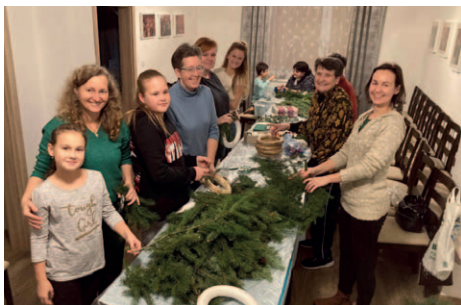
Společné pletení věnečků provázela pohoda a radost.