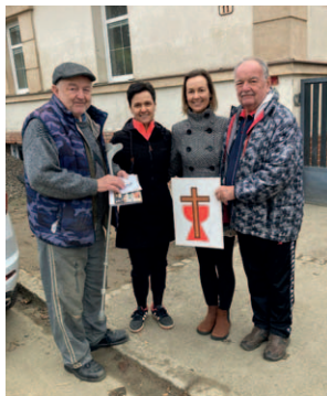
Předání darů na pomoc po povodních bratrům v Opavě